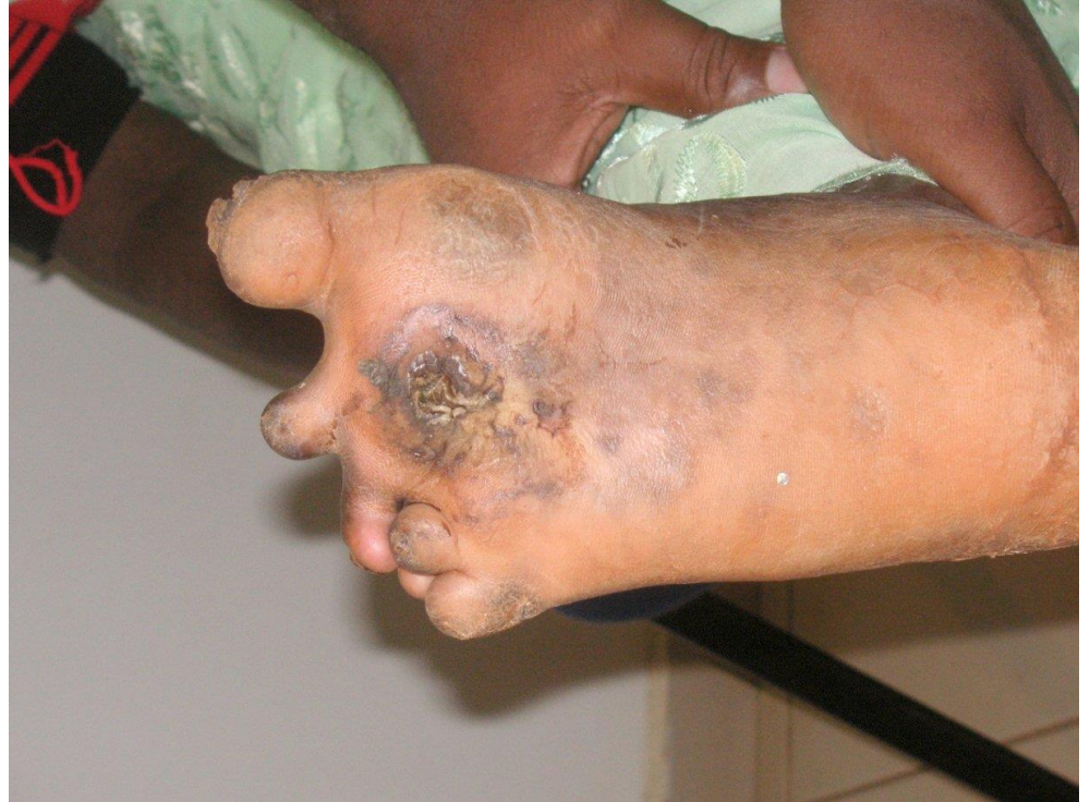
Mal perforant plantaire

Cette atteinte neurologique est presque toujours associée à des lésions cutanées.